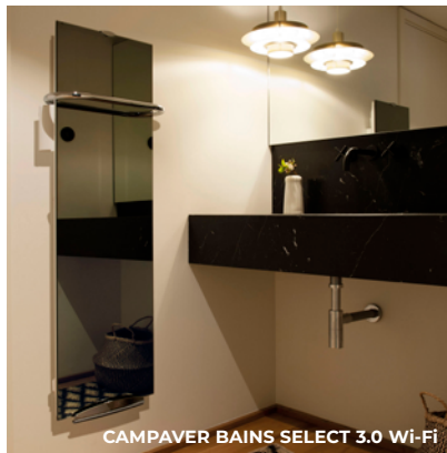
CAMPAVER BAINS SELECT 3.0 Wi-Fi

Rouge Rubis, Vert Oxford, Noir Astrakan, Vert Lagon, Reflet „effet miroir”