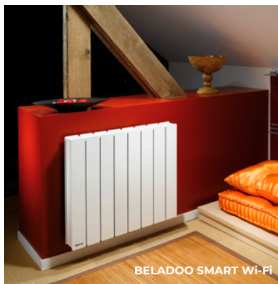
BELADOO SMART Wi-Fi