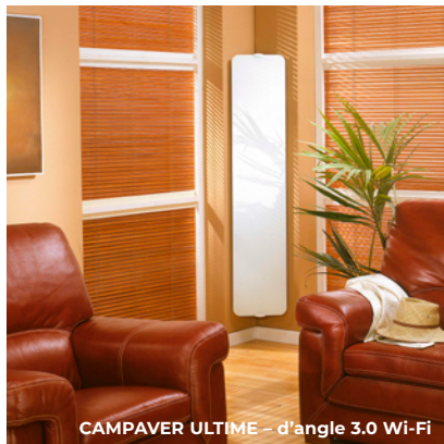
CAMPAVER ULTIME – d'angle 3.0 Wi-Fi