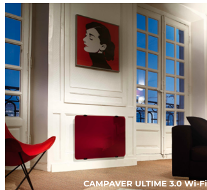
CAMPAVER ULTIME 3.0 Wi-Fi

Typ: promienniki naścienne i suszarka z nadmuchem (system uchwyty do suszenia)